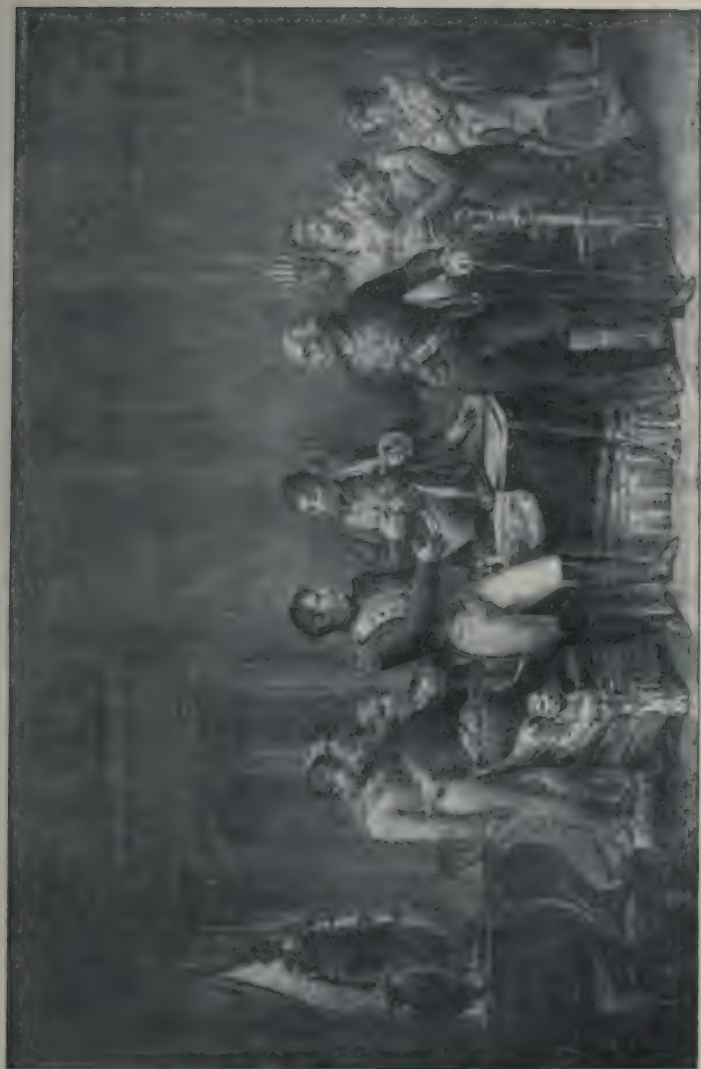
L'Abdication de Bayonne.

(Dessiné de B. Zard. Lithographie de G. Motte. (Bibliothèque Nationale Estampes.)